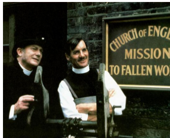
1982 DRÔLE DE MISSIONNAIRE (The Missionary) de Richard Loncraine avec Michael Palin