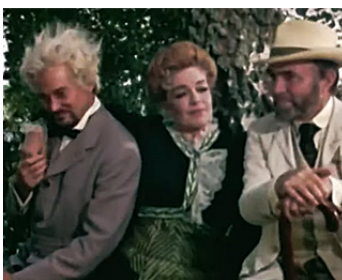
1968 LA MOUETTE (The Sea Gull) de Sidney Lumet avec Simone Signoret, James Mason