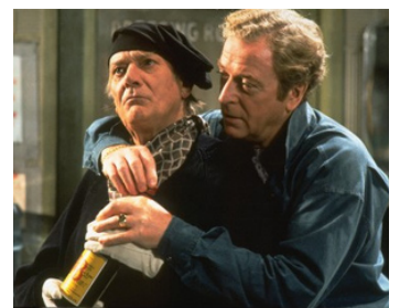
1992 BRUITS DE COULISSES (Noises Off...) de Peter Bogdanovich avec Michael Caine