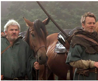
1976 LA ROSE ET LA FLÈCHE (Robin and Marian) de Richard Lester avec Nicol Williamson