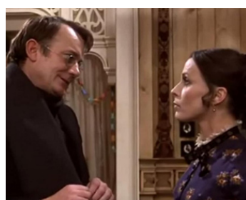
1973 LA MAISON DE POUPÉE (A Doll's House) de Patrick Garland avec Claire Bloom