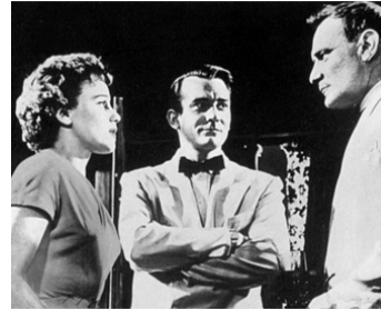
1953 THE HEART OF MATTER de George More O'Ferrall avec Elizabeth Allan, Trevor Howard