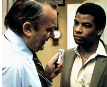
1980 RISING DAMP de Joseph McGrath avec Don Warrington