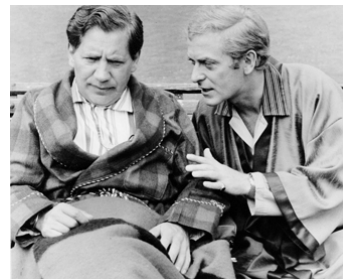
1966 ALFIE LE DRAGUEUR (Alfie) de Lewis Gilbert avec Michael Caine