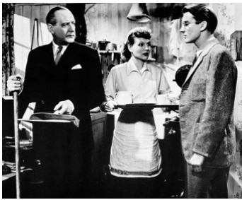
1949 DEAR MR PROHACK de Thornton Freeland avec Cecil Parker, Sheila Sim