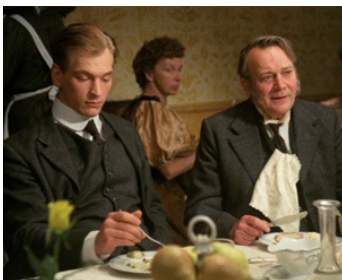
1985 CHAMBRE AVEC VUE (A Room with a View) de James Ivory avec Julian Sands