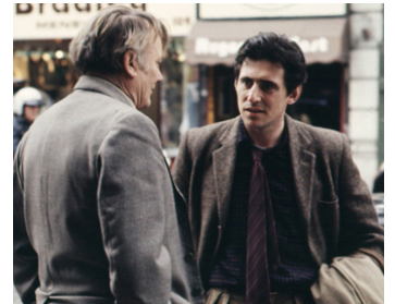
1985 RAISON D'ÉTAT (Defence of the Realm) de David Drury avec Gabriel Byrne