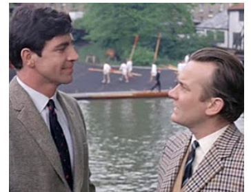
1964 TOUT OU RIEN (Nothing but the Best) de Clive Donner avec Alan Bates