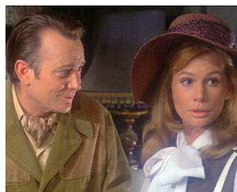
1971 LA MAISON QUI TUE (The House that dripped Blood) de Peter Duffell avec Joanna Dunham