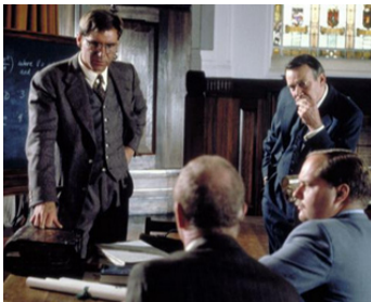
1981 LES AVENTURIERS DE L'ARCHE PERDUE de Steven Spielberg avec Harrison Ford