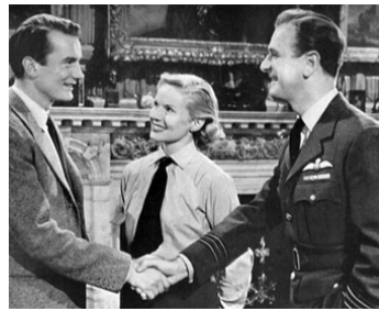
1952 LE MUR DU SON (The Sound Barrier) de David Lean avec Ann Todd, Nigel Patrick