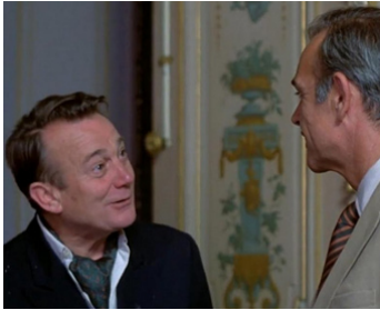
1979 CUBA (Cuba) de Richard Lester avec Sean Connery