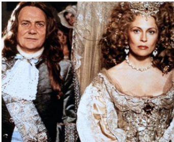
1983 LA DÉPRAVÉE (The Wicked Lady) de Michael Winner avec Faye Dunaway