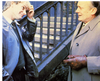
1982 PIERRE QUI BRÛLE (Brimstone & Treacle) de Richard Loncraine avec Sting