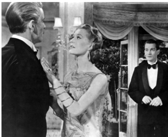
1955 L'HOMME QUI AIMAIT LES ROUSSSES d'Harold French avec R. Culver, Moira Shearer