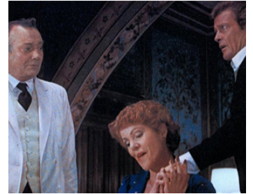
1980 LES SÉDUCTEURS (Sunday Lovers) de Bryan Forbes avec Lynn Redgrave, Roger Moore