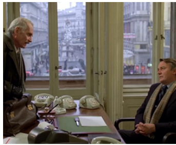
1978 CES GARÇONS QUI VENAIENT DU BRÉSIL de Franklin J. Schaffner avec Laurence Olivier