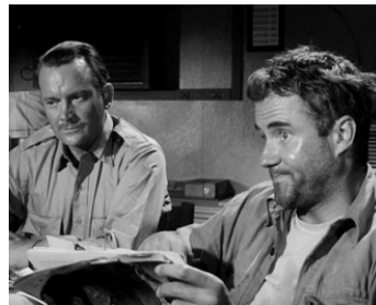
1962 LA BLONDE DE LA STATION 6 (Station Six-Sahara) de Seth Holt avec Ian Bannen