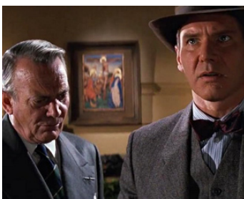
1989 INDIANA JONES ET LA DERNIÈRE CROISADE de S. Spielberg avec Harrison Ford