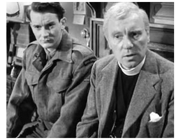
1952 THE HOLLY AND THE IVY de George More O'Ferrall avec Ralph Richardson