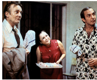
1979 JACK LE MAGNIFIQUE (Saint Jack) de Peter Bogdanovich avec Ben Gazzara