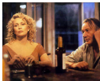
1991 SCORCHERS (Scorchers) de David Beaird avec Faye Dunaway