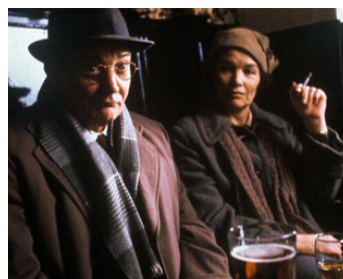
1991 LES CHANDELLES NOIRES (A Murder of Quality) de Gavin Millar avec Glenda Jackson