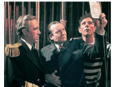
1968 STRIP-TEASE CHEZ MINSKI de William Friedkin avec Jason Robards, Norman Wisdom