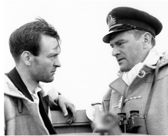
1953 LA MER CRUELLE (The Cruel Sea) de Charles Frennd avec Jack Hawkins