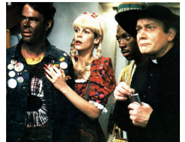
1983 UN FAUTEUIL POUR DEUX (Trading Places) de J. Landis avec D. Aykroyd, J.L. Curtis, E. Murphy