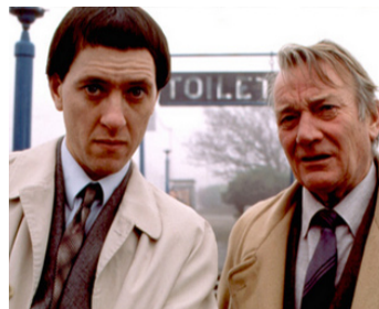
1989 KILLING DAD (Killing Dad or How to Love Your Mother) de M. Austin avec Richard E. Grant