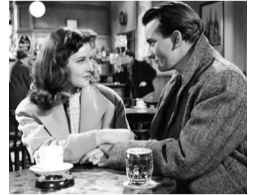
1954 LEASE OF LIFE de Charles Frennd avec Adrienne Corri