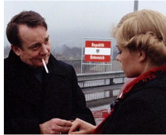
1980 ENQUÊTE SUR UNE PASSION (Bad Timing) de Nicolas Roeg avec Theresa Russell