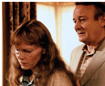
1987 SEPTEMBER (September) de Woody Allen avec Mia Farrow