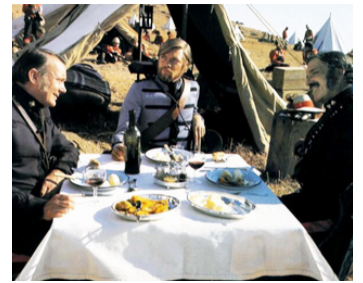
1979 L'ULTIME ATTAQUE (Zulu Dawn) de Douglas Hickox avec Simon Ward, Burt Lancaster