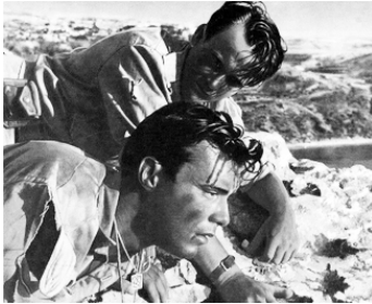
1953 COMMANDO À RHODES (They Who Dare) de Lewis Milestone avec Dirk Bogarde