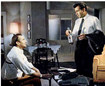
1964 DERNIÈRE MISSION À NICOSIE (The High Bright Sun) de Ralph Thomas avec D. Bogarde