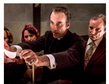
1976 UNE FILLE... POUR LE DIABLE (To the Devil a Daughter) de P. Sykes avec Christopher Lee