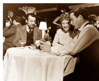
1974 L'APPRENTISSAGE DE DUDDY KRAVITZ de Ted Kotcheff avec M. Lanctot, R. Dreyfuss