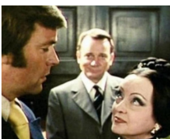
1972 L'EMPIRE DE MADAME SIN (Madame Sin) de David Greene avec R. Wagner, Bette Davis