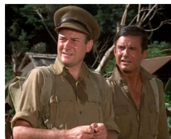
1970 TROP TARD POUR LES HÉROS (Too late the Hero) de R. Aldrich avec Cliff Robertson