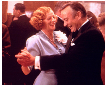
1984 PORC ROYAL (A Private Function) de Malcolm Mowbray avec Maggie Smith