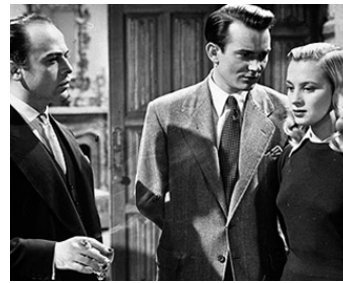
1952 L'ASSASSIN A DE L'HUMOUR (The Ringer) de G. Hamilton avec H. Lom, Mai Zetterling